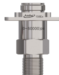
ADT158Ex 圧力モジュール - ADT273Ex ボトムマウントで使用