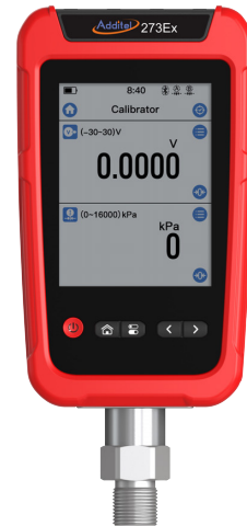
Additel 273Ex 本体と ADT158Ex モジュール