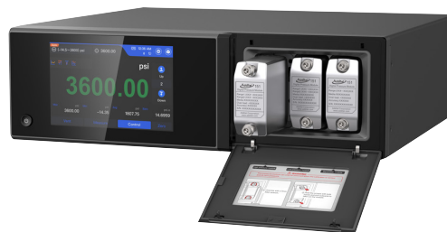
Additel 783 に ADT151 圧カモジュールを実装