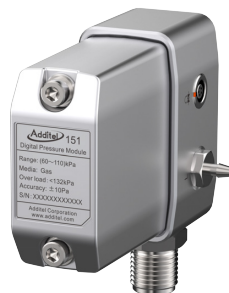
校正フィクスチャ付き BP 圧力モジュール