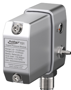
校正フィクスチャ付き CP 圧力モジュール

[1] 大気圧モジュールは ADT773/ADT783/ADT793 の別売オプションです。大気圧モジュールを挿入した後、コントローラーはゲージ圧力単位と絶対圧力単位を切り替えることができます。